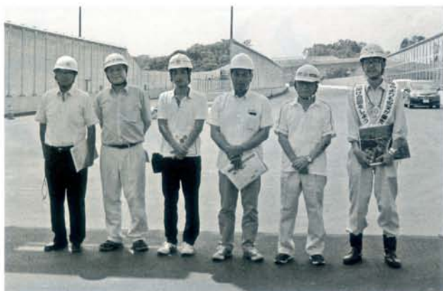
▲写真1 豊田工事事務所小原課長（右端）と広報委員

今回は前号の中日本高速道路㈱豊川工事事務所の管内に引き続き、同社豊田工事事務所の厚意によ