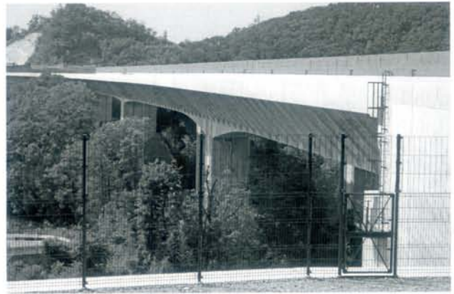
▲写真3 郡界川橋と立ち入り防止柵（手前）

さで柵が設置されています。また下の部分は土中に埋められています。こうしてあれば、シカが上を乗り越えられないし、イノシシやタヌキ等の小動物も下をくぐることはできないからです。