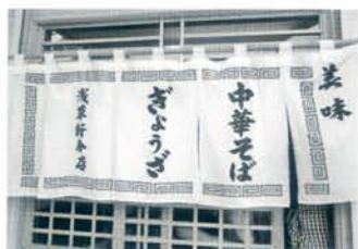
この暖簾の先においしさが待っています。

る今もジワつときます。メニューはこの「中華そば（大盛りもあります）」と大ぶりの餃子のみ。場所は浜松市舞阪町の国道1号沿いを弁天島方面に向かって静岡銀行舞阪支店の直ぐ西側を左折。150mほど先の右側にお店があります。休みはやや不定期なので事前に確かめていくのがベター。さあぜひ一度足を伸ばして味わってみて下さい。