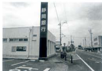
国道1号沿いの静岡銀行舞阪支店の直ぐ西側を左折。