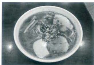
来ました！大盛り中華そば。いただきます。