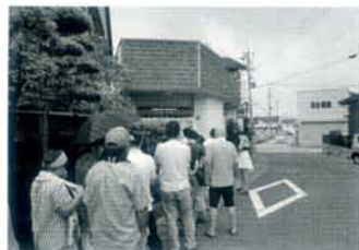
昼時はさすがに行列ができます。

何といっても私のお薦めは浜松市西区舞阪町にある「浅草軒分店」。ああ、あそこねとご存知の方も多いかと思ひます。ベースが豚骨か鶏に魚介系の出汁が加わっていわゆるスープレの絶妙な香りに見事に絡まる醤油ラーメン。よく昔ながらの味という評価を聞きますが、ここのはまさに本物の懐かしい味。いついつても変わらぬこのスープと麺に引き込まれて早20年。書いてい