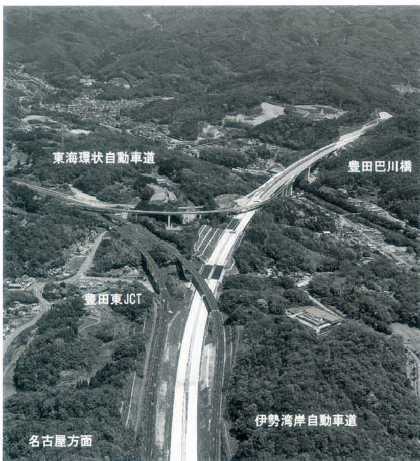
▲写真2 豊田東JCTの様子

山あいを通る新東名では走行車両の安全確保のため、全線に亘り敷地の境界線などに沿って2・5mの高