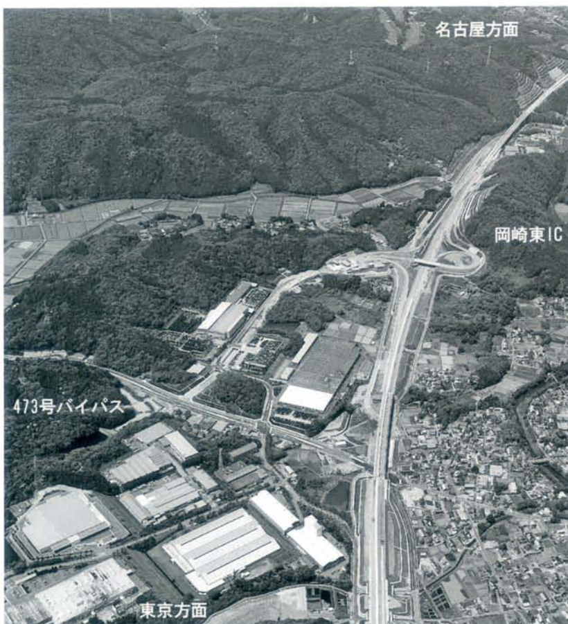
▲写真4 岡崎東ICと国道473号BP

こうした現場を取材させていただき改めて強く感じたのは、豊田工事事務所の全ての関係者の皆様の英知と懸命の努力、そして最先端の工数技術・機材といった総合力が実を結び、確実にゴールが見えてきたことです。改めて、新東名の無事完成とともに豊田工事事務所の皆様のご健勝とご活躍を祈念し、お礼に代えさせていただきます。