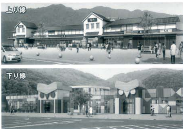
▲岡崎SAイメージパース

下り線は森のエントランスとした建物が建築中です（イメージパース参照）。周囲をなだらかな山々に囲まれたこのSAでどんなグルメやグッズなどに出会えるのかオープンが今から楽しみです。 最後は岡崎東IC（写真4）。ETCと遠隔対応により料金収受（いわゆる無人）の機械化料金所です。入口と出口それぞれ3台ずつのゲートをはじめ、上下のランプウェイや料金所で仮に人手が必要となった場合や保守点検用としても利用できる地下通路、車両の重量感知などの施設も出来上がっています。 国道473号バイパスもすでに供用しており、アクセスも十分です。