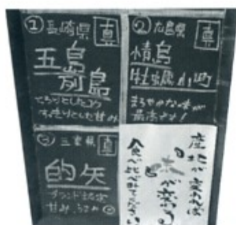
生かきの食べ比べ…入荷により産地が変わります。

ただ、唯一、ビールのコップがプラスチックなのがちょっと残念ですが、Hさんのように日本酒にすれば大丈夫。酔い酔いで、良い良いです。