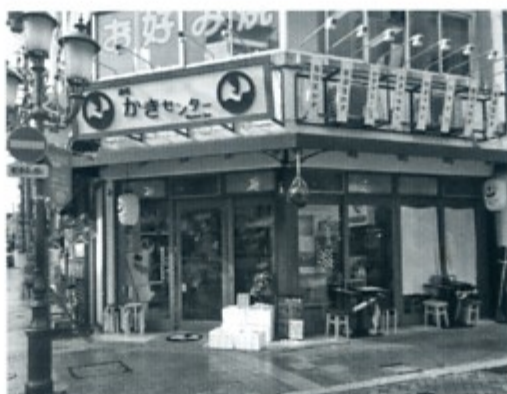
お店入口です。夜には大変にぎわいます。

寒風吹くこの時期のお勧めといえば、「なべ」といいたるところですが、今回は牡蠣をご紹介します。