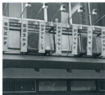
入口上のメインメニュー？