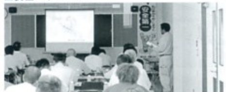
▲土木工事現場技術発表会

▼行政とのパートナーシップづくり もうひとつ、良質な工事の基本は発注者と受注者のパートナーシップにあります。