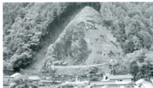
急斜面でのバックホーによる掘削作業