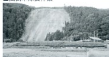
▲春野地すべり応急排水路造成