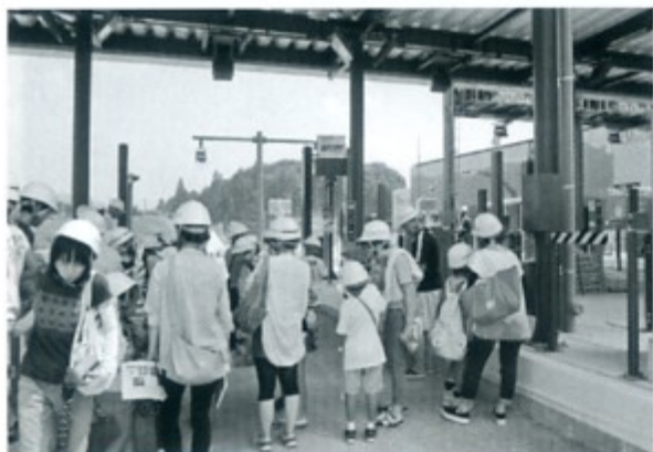
▲夏休み親子現場見学会

「道路愛護除草」は、8月の道路ふれあい月間に合わせ、会員各社が総出で天竜区内の国道道沿いの生い茂った雑草の刈り取りを行ない、地域道路の見通しとすっきりとした沿道を確保します。