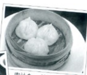
肉汁たっぷりの小籠包