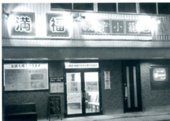
中国人店主の餃子・小籠包専門店

最近私のはまっている店を紹介 します。浜北区小松の杏林堂の筋 向いの餃子・小籠包の専門店『満福』 (看板が派手なのですぐわかる) ここの餃子がうまい!!