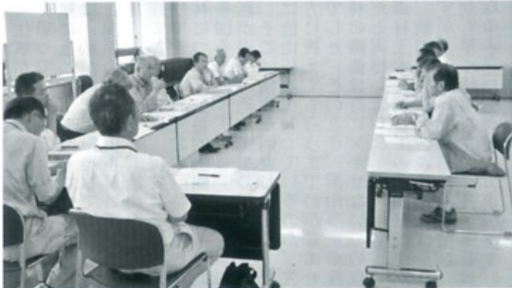
▲行政との意見交換会

私たちの住む天竜区は急峻かつ複雑な地形や地質から、時には危険と隣り合わせで大変な労力と独特の技術・工法を要する難工事も多くあります。夏の焼けつくような猛暑や冬の凍える寒さなどシビアな環境条件下にもあります。そうした中においても、我々天竜建設業協会の会員各社は、地域の生活の向上と安全・安心な社会づくりに向けて、誇りと使命感を持って今後とも頑張っています。