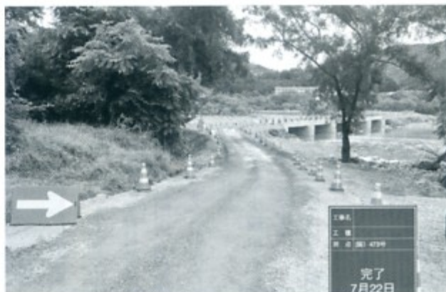
▲原田橋緊急迂回路造成

また、今年度は協会の自主的な取り組みとして天竜区内の「災害危険箇所調査」を実施します。天竜区は急峻な地形や谷底を流れる河川の多さなどから各所で災害が発生します。このため、主に県浜松土木事務所管理施設を中心に、区内の河川の氾濫や土砂崩れなどの危険箇所を現地調査し、行政に工事方法なども含め、提案していきたいと考えています。