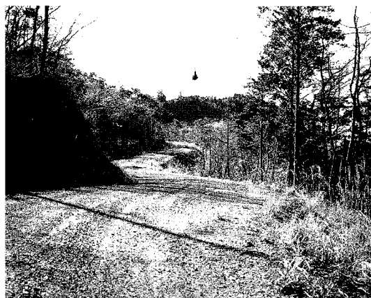
開設された地区 天竜市懐山

の迂回路や三遠南信路のアクセス、沿線にある浜北森林公園や観音山少年自然の家等の利用促進にも多くの期待が寄せられているとのことでした。