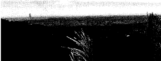
清水地区から浜北・浜松方面をのぞむ アクトタワーが見える ここから見る夜景が最高