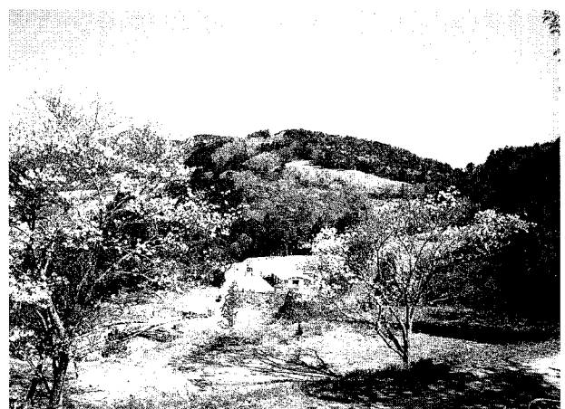
旧『山放牧場跡地、 下に見えるのが乗馬クラブ

下刈り・除伐や間伐によって森林を生かし、治山治水・CO 2 の削減・地球温暖化防止等森林によって生かされる、人と自然とが共生する社会づくりが求められているのだと、改めて痛感した次第です。