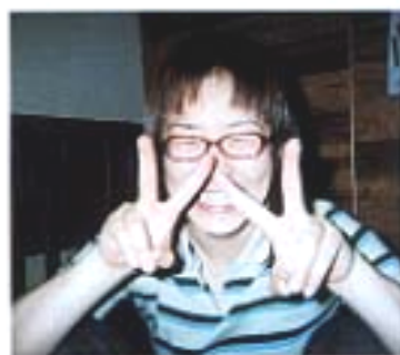
春野建設事業(協) 総務課 庶務係