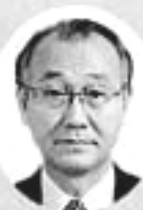
北遠農林事務所長