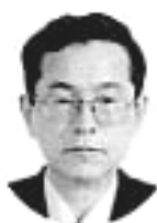
天竜土木事務所長

今年度は協会発足五十周年にあたる年。節目にあたって、会員皆様の一層の結束と発展を期待しております。豊かな自然に育まれた天竜地域が魅力あふれる地域となるよう鋭意努力いたす所存でありますので、皆様方のご支援をお願い申し上げます。