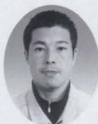
天龍土建工業 福田 匠