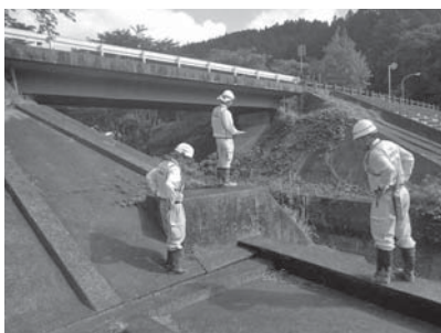
徒歩による災害危険箇所調査風景

今年度天竜地区では、①H28河川とH29天竜東栄線危険度Aの再調査28箇所、②H30年度新規として両島一俣、横山熊線を調査し、29箇所危険箇所を洗い出し、五地区全体としては94箇所調査報告をまとめた。