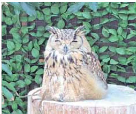
マツコデラックス？

夏休み前の平日で、時間も早かった為か、満車には程遠かったけど、これくらい広ければ夏休みでも大丈夫かな？ 大人入場料千四百円を払い中へ入る。入口の花売店を抜け、ペンギンプールを横に見て扉を開けると、エアコンの効いた広いがらんとした部屋が。？何もないの？と思ったせつな、左下に何か気配を感じる。見るとかわいい鳥のぬいぐるみかと思ったら、ピクリと動く。