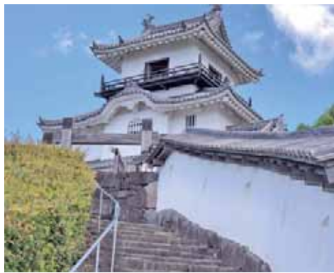
下から仰ぎ見る掛川城

天守閣から見る掛川市内はにぎ やかく、やけににぎやかだと思っ たら、すぐ隣の掛川西高で野球の 猛練習中。今現在、夏の県内ベス ト8に入っており、甲子園めざし