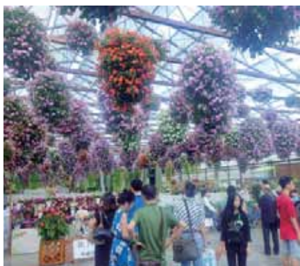
きれいな花と中国系観光客

まずは掛川花鳥園。皆、テレビで名前は知っているけど行ったことではないということで、少しわくわく。天浜線のパンフレットの小さな地図を頼りに行ってみると、意外に大きな駐車場。