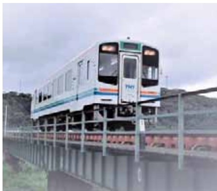
天浜線で掛川へ出発

猛暑真っ只中の7月某日。熱風でへろへろの体力をふりしぼり、広報委員有志3名で天浜線始発(終着?) 掛川駅付近の見所を探りに行きました。