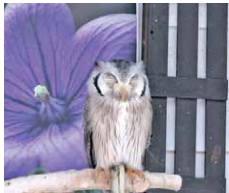
変身が得意なポポちゃん

えっ、え？生きている！丸太の上にかわいい鳥が、ふくろう達がちよこんと立って(座って?) いる。ちよこつと首を振ったり、目を開いたり。一番奥には、変身で有名なポポちゃんがくたびれて寝ていた。