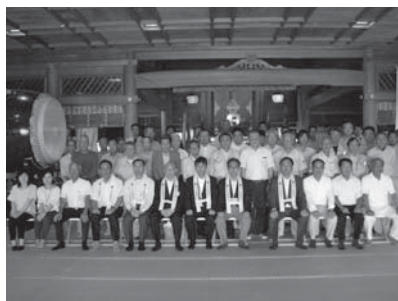
秋葉神社上社拝殿での安全祈願

7月4日、協会と防災防天竜分会は、来賓・会員51名の出席のもと、秋葉神社上社において平成30年度安全祈願祭・安全大会を開催した。