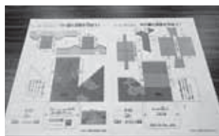
ペーパークラフト 展開図

浜松土木事務所では、このような出前講座を今後も開催していきたいと考えておりますので、ご要望があれば是非ご一報ください。お待ちしております。