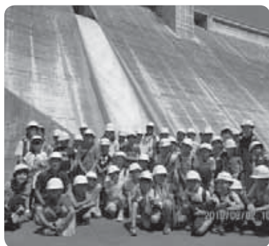
ダムの放流前で記念撮影

子供たちからは、①洪水を防ぐため②飲み水を貯めるため③うるおいのある川にするためのダムだと分かったとの声が聞かれました。