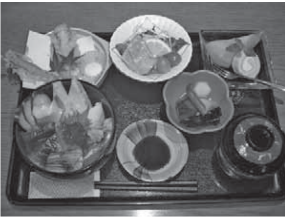
レディース美食膳