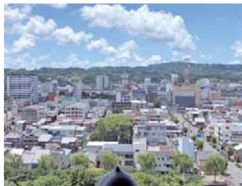
天守閣からの掛川市内

頑張っているのだ。 残念ながら、天浜線掛川駅はピ ルの陰に隠れていたけど、そう、 掛川は野球も盛んなところだっ け。