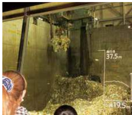
クレーンでもえるごみを持ち上げ