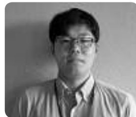
静岡県西部農林事務所 天竜農林局 治山課