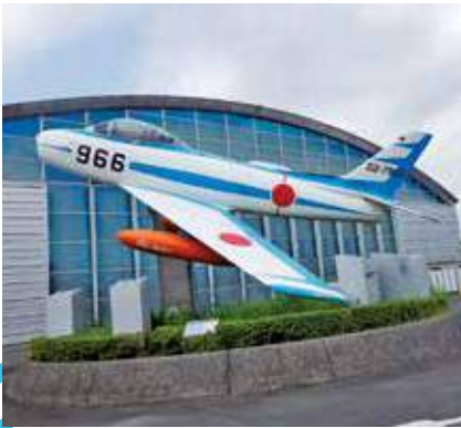
自衛隊機の展示(屋外)