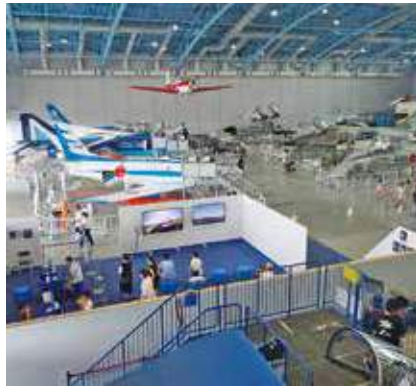
自衛隊機の展示(展示格納庫内)