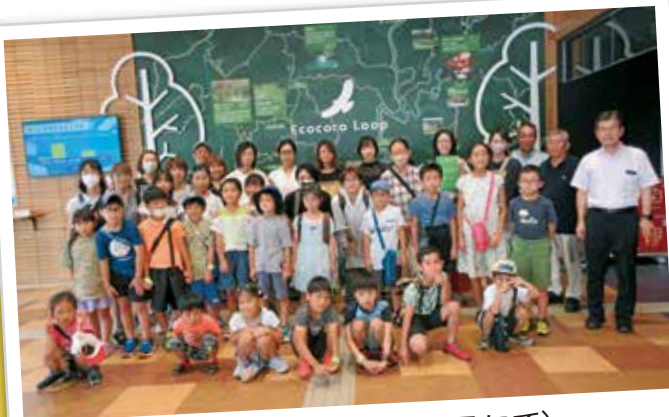
集合写真(天竜エコテラスにて)

・自衛隊の服を着てブルーインパルスに乗ったことが楽しかった。フライトシミュレーションがすごく難しかった。 ・飛行機に乗ったり、シミュレーターで飛行機を操縦してみたり、実際にやれることがたくさんあって楽しかった。