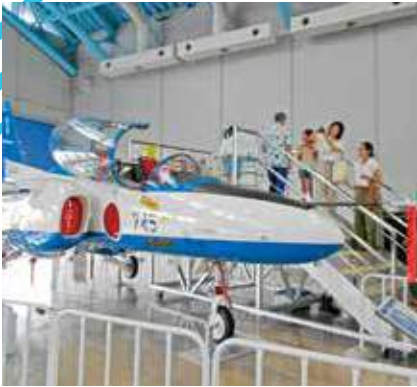
操縦席で写真撮影