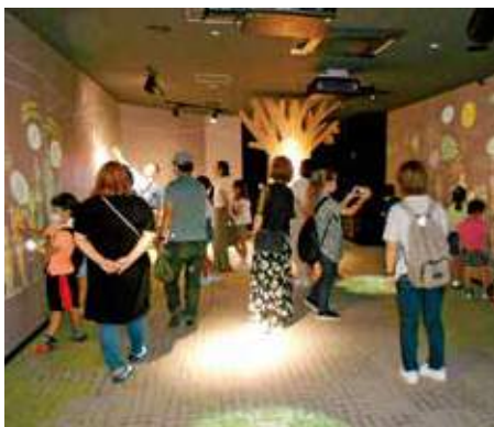
タッチアニメーションでエコ学習