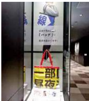
ごみから生まれ変わったバッグ