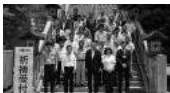
秋葉神社上社での安全祈願祭