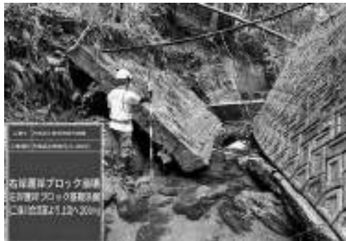
災害危険箇所調査