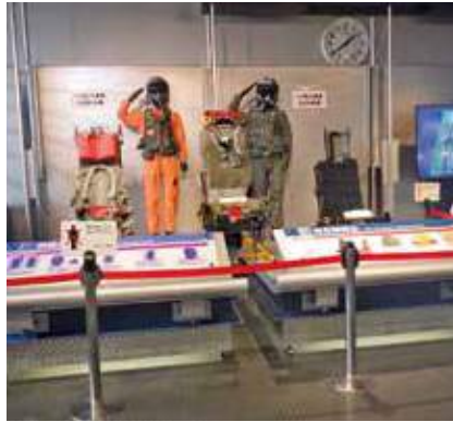
自衛隊制服の展示