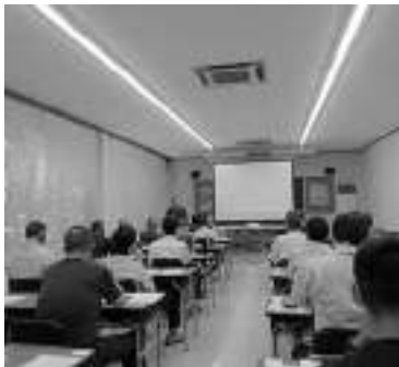
足場の組立て等作業主任者能力向上教育

足場の組立て等の最新の知識と技能の再教育を目的とした講習内容で、受講者の皆さんは足場の組立て等作業主任者技能講習を修了した方々のため、安全に対する意識がとて高く熱心に聴講されました。